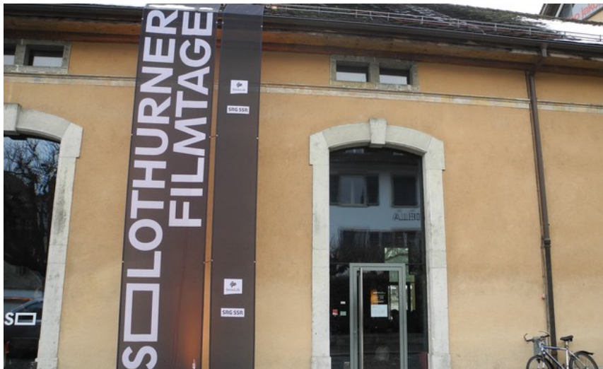
Aussenansicht des «Solheure»

Im Kino Uferbau ist während der Filmtage so einiges los. Wie sieht es nebenan im Restaurant «Solheure» aus?